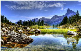
Legende nec usu nec ratione habent

Iam in altera philosophiae parte. quae est quaerendi ac disserendi, quae logikh dicitur, iste vester plane, ut mihi quidem videtur, inermis ac nudus est. tollit definitiones, nihil de dividendo ac partiendo docet, non quo modo efficiatur concludaturque ratio tradit, non qua via captiosa solvantur ambigua distinguantur ostendit; iudicia rerum in sensibus ponit, quibus si semel aliquid falsi pro vero probatum sit, sublatum esse omne iudicium veri et falsi putat.