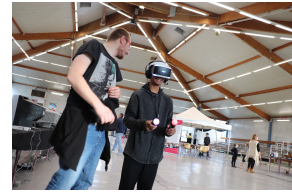
Metuentes igitur idem latrones