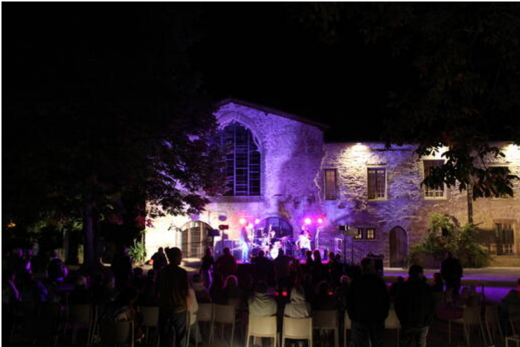
La légende de l'image