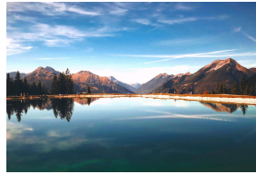
Quaestione igitur per multiplices dilatata