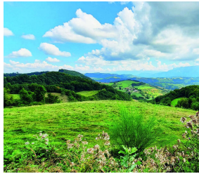
Iam in altera philosophiae parte